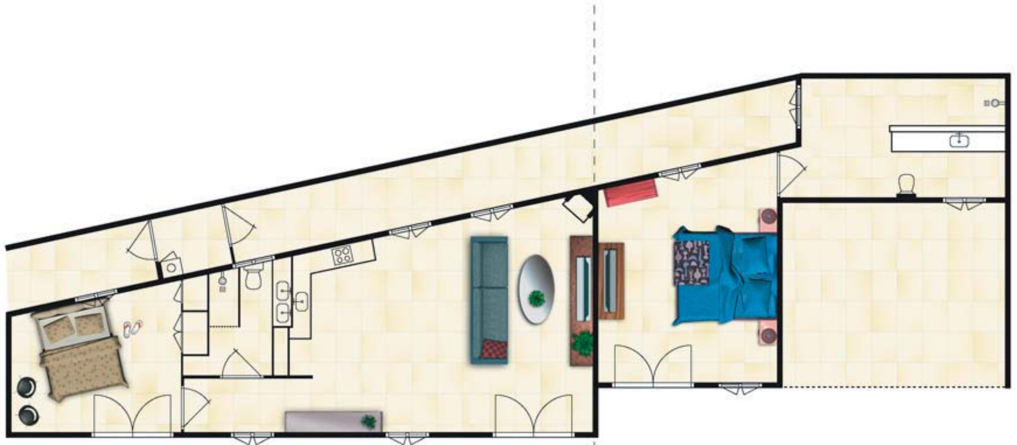
Gastenverblijf C 54 m 2